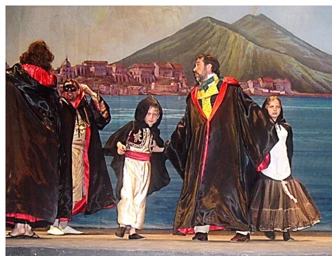
Il Turco in Italia di Gioachino Rossini – edizione 2005-2006